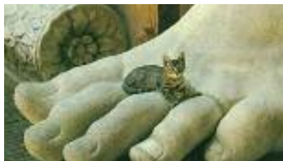
Dat ligt prima!

bezienswaardigheden bezocht, een heerlijke koffie gedronken of overheerlijk ijs gegeten (allemaal géén probleem in Rome), dan is het echt