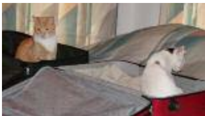
Kom op, we gaan!

T orre Argentina, Roman Cat Sanctuary heet het. En u zult geen moeite hebben om het te vinden wanneer u in Rome bent. In veel reisgidsen en (zeker) op internet kunt u er niet omheen. Midden in de stad (nou ja) in een historische setting zult u tientallen katten vinden. Verstoten en verwaarloosde viervoetertjes die alle steun en hulp kunnen gebruiken die er maar voorhanden is.