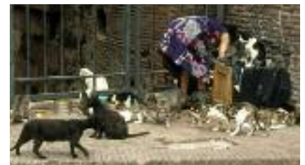
Veel hongerige gasten.

daar aan en binnen de kortste keren lag er een spinnende kat op schoot. Jammer genoeg kan je daar niet de hele dag blijven zitten (dat schiet